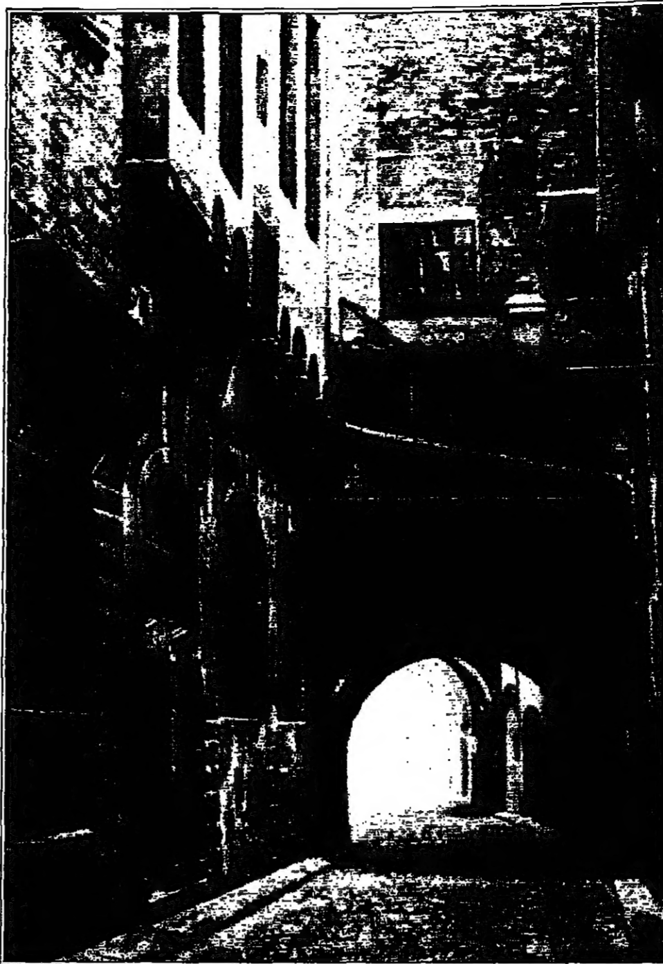
من اعمال بشير مهدي

أرى ان الصور التي رسمها بشير مهدي تتفتح على الفضاءات البصرية التي تخرج من جرافيكها التي يظن ان يمتدح بها ان كان للمجد هو زمن الحداثة او الواقعية التي ما تزال تحتفظ بنفوسها وبيئاتها فيها او صورتها للبره في حين ان الفضاء الخارجي للتحقق وتحتفظ بالانطلاق والظهور للعامة ولكن هذا لشهد قد اعيد ترتيبه وانتاجه على نحو